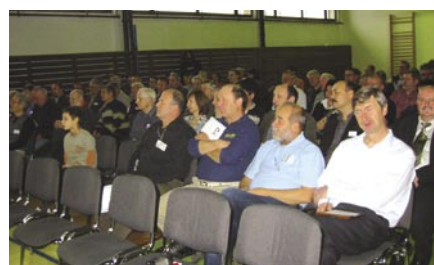
Uczestnicy oficjalnej części spotkania OM