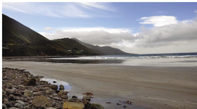
Tu i na poprzedniej stronie przykładowe fotogramy z wernisażu Grzegorza SP3CSD