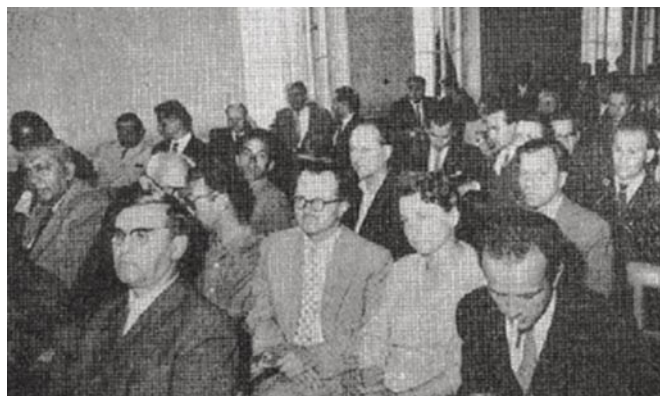
Sala obrad zjazdu PZK 1960

W dniu 27 czerwca 1965 r. obradował w Warszawie V Krajowy Zjazd Polskiego Związku Krótkofalowców, przy licznych udziale wybitnych przedstawicieli Rządu, Resortu Łączności i Wojska. Zjazd podsumował działalność za okres poprzedniej ka-