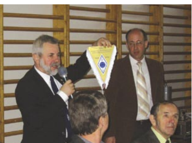
Roman OM3EI otrzymuje okolicznościowy proporzyczek 80 lat PZK-85 lat IARU