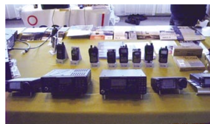
Stoisko ICOM na giełdzie w hotelu Hutnik