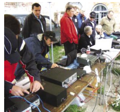
Praca stacji okolicznościowej HF2010TM i testowanie sprzętu

Zarówno w sobotę jak i w niedzielę pogoda nie rozpieszczała, chwilami pojawiało się nawet słońce, ale zamiennie z opadami deszczu, co znacząco wpłynęło na skrócenie czasu pobytu przez spore grono uczestników zjazdu. W trakcie Złotu była możliwość skorzystania z barku, gdzie serwowano karkówkę z grilla, kiełbaski i inne przekaśki oraz rozmaite napoje. Dla wytrwałych została dostarczona gorąca wojskowa grochówka, którą można było spożywać w ciepłym bijącym od rozpalonego ogniska, a na dokładkę do grochówki zjeść