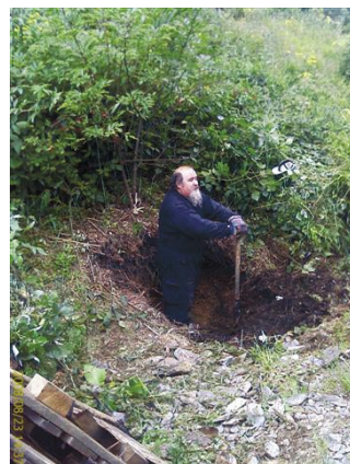
SP6MRC rozpoczyna kopanie

dzo pracowicie a dolegliwości z tym związane czuliśmy jeszcze przez kilka następných dni. Dobrze że sama praca wykonywana była na wesoło i bez żadnego wypadku, powstało nawet humorystyczne powiedzenie że oto „słowacki cement wymieszany w Czechach jest wylewany w Polsce”, tak faktycznie było bo przez szczyt przechodzi granica państwa. Już za tydzień w sobotę znowu uparcie wędrujemy pod górę żeby przekonać się że nasz beton jest twardy jak kamień i można przystąpić do ustawiania szalunku. Przez cały dzień dźwigamy drewniane belki, zakładamy stalowe liny żeby zdążyć wieczorem wrócić do domów zbytnio nie rozciągając rodzinnej harmonii. Prawie równo z nami pracują ale na starym maszcie koledzy krótkofalowcy z Brzegu i oto z Biskupiej Kopy odzywa się przyniesiony tu w plecaku przemiennik SR6KB. Brawo, tak trzymać! Kolejna sobota (nie