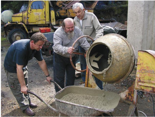
Pierwsza taczka zaprawy

cją na nasze dzieło stwierdzamy zgodnie że korzystać z tego będą jeszcze nasze wnuki. Bardzo solidna konstrukcja stalowej stopy wykonanej przez SP6MRC wraz z fachowo pospawanym przez Mirka zbrojeniem oraz potężna porcja betonu powoduje że całość wygląda imponująco nawet jak na górskie warunki. Ze szczytu schodzimy na czeską stronę bo krócej ale okazuje się że do domu nie dojedziemy tak szybko bo po drodze mieszka OK2MXL któremu koniecznie trzeba złożyć życzenia urodzinowe co oczywiście czynimy i po chwili siedzimy u Jardy w ogrodzie przy odpowiednio zastawionym stole. Na zakończenie wypada wymienić znaki dotychczas pracujących na szczycie ludzi więc SP6MRC to główna siła napędowa całej inwestycji oraz; SP6EZ, SP6OUX, SP6TPI, SP6TPG, SQ6QQ, SP6MQO, SP9LJE, SQ6IUA, SQ6IUF, SQ6IUS, SP9UO i grupka kolegów z SP7KED.