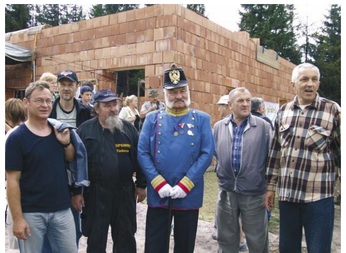
„Cysorz” z zespołem SP9KDA