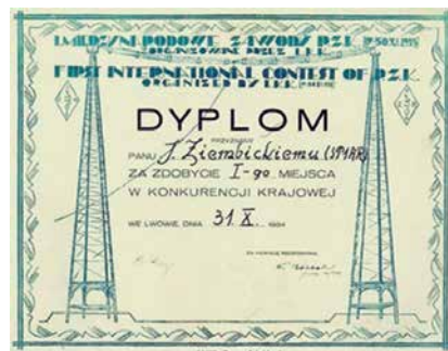
DYPLOM UZYSKANY PRZEZ SP1AR W PIERWSZYM SPDXCON-TESTIE