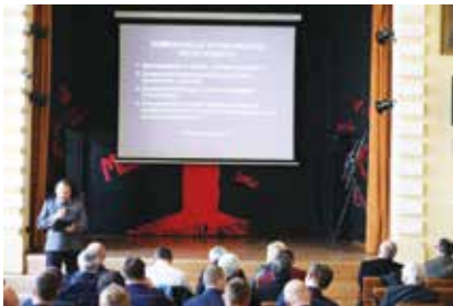
JEDNA Z PREZENTACJI NA TEMAT ŁĄCZNOŚCI REZERWOWEJ