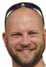
Vy 73! Remi SQ7AN

Na deser zostaje nam uczestnictwo w debacie poświęconej tematu komunikacji w warunkach kryzysowych, połączone z poznaniem historii klubu SP9PEW. To wszystko znajdujemy w niniejszym numerze KP. Zapraszam do lektury.