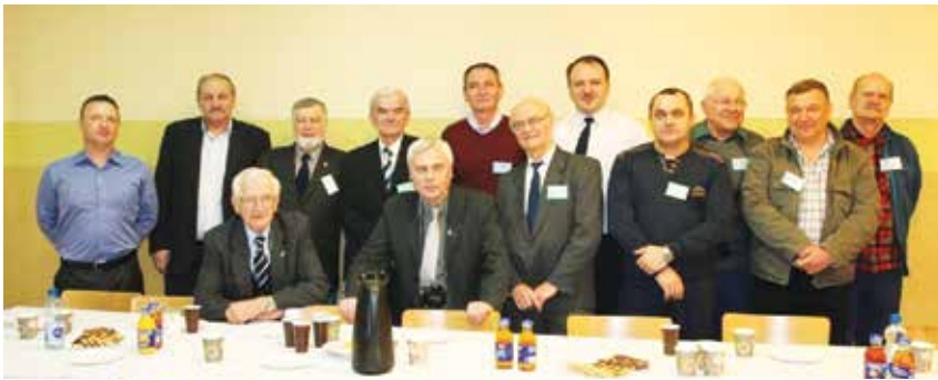
UCZESTNICY SPOTKANIA W LUBLINCIU