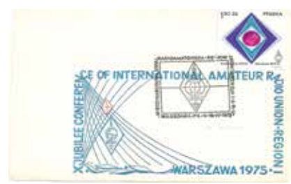
OKOLICZNOŚCIOWA KOPERTA ZE ZNACZKIEM Z OKAZJI X KONFERENCJI R1 IARU