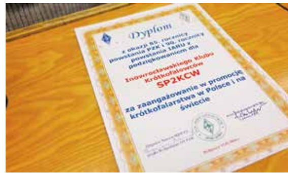
DYPLOM DLA KLUBU SP2KCV