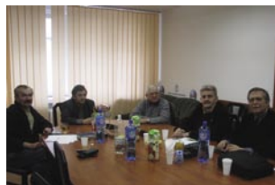
Posiedzenie komisji łączności

Brakuje jeszcze zgłoszeń od Stowarzyszeń z Rosji, Bułgarii, Rumuni i Ukrainy. Termin Mistrzostw HST-2010 został wynegocjowany przez Rosjan na spotkaniu HST WG w Obzor