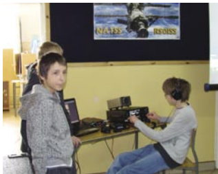
Młodzi operatorzy stacji klubowej SP5PMD

ze stacją ISS trwała dość krótko, bo około 10 minut to stacja klubowa SP5PMD nawiązała jako pierwsza łączność ze stacją SN0ISS, którą przeprowadziłem osobiście a którą z zainteresowaniem wysłuchali wszyscy obecni. – Mam nadzieję, że z tej grupy na pewno wielu uczniów zainteresuje krótkofalarstwo.