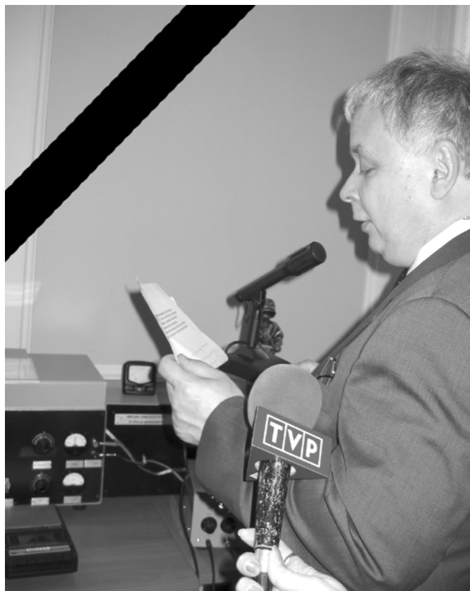
Pan Prezydent Warszawy Lech Kaczyński podczas nadawania przez replikę radiostacji „Błyskawica”