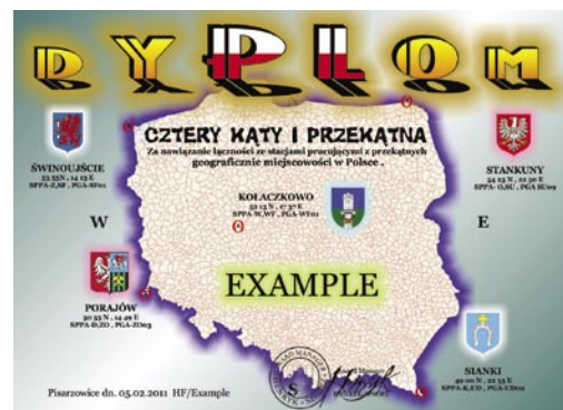
Dyplom „4 Kąty i przekątna“

Zalicza się łączności od 1 stycznia 2010 roku. Wymagany wyciąg z logu stacyjnego (GCR). Zastrzeżenie prawo do kontroli kart QSL. Dyplom formatu A-4 w pełnym kolorze – foliowany. Stacje europejskie 4 QSO/HRD, stacje DX – 2 QSO/HRD. Koszt dyplomu – stacje polskie 20 zł, stacje zagraniczne – 10 IRC (10 E, 15 $). Wydawca: SP6OPZ, P. O. Box 52, 58-400 Kamienna Góra Wpłaty na konto: 51-1500-1429-1014-2011-1197-0000 (potwierdzenie wpłaty e-mailem). Tel.: +48 507 345 207, e-mail: sp6opz1@wp.pl