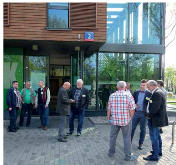
ROZMOWY DELEGATÓW PRZED CPK...

Niezależnie od kwestii prawnych, do rozstrzygnięcia których jest władny wyłącznie zjazd, to stanowi on okazję do spotkania kolegów będących najwyższym organem władzy w naszym stowarzyszeniu. Dużo kwestii nie tylko związanych ze zjazdem, ale i z bieżącą działalnością PZK jest dyskutowanych i często załatwianych w tzw. kuluarach. Tego aspektu władza wykonawcza, czyli prezydium, nie powinna lekceważyć i tak też działamy.