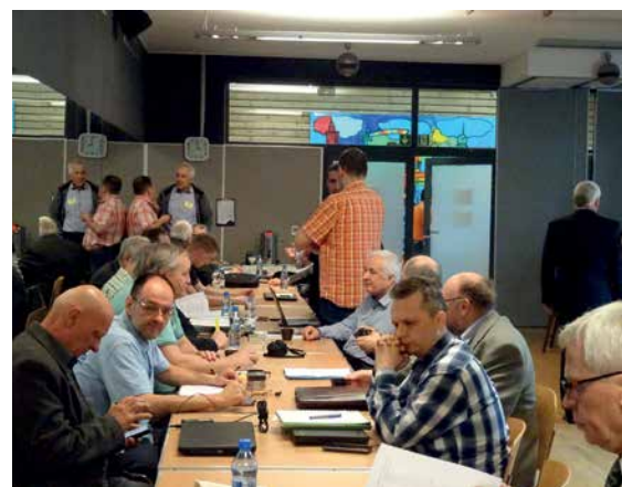
KRÓTKA PRZERWA – ROZMOWY W KULUARACH