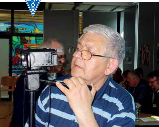
JUREK SP5BLD Z RBI NIESTRUDZENIE FILMOWAŁ I NAGRYWAŁ CAŁOŚĆ DLA POTOMNOŚCI