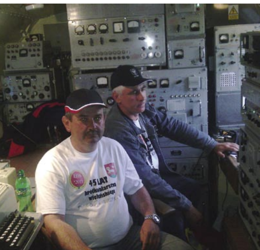
„SQ9OUA oraz SQ6IUF w pomieszczeniu radiostacji R-140”