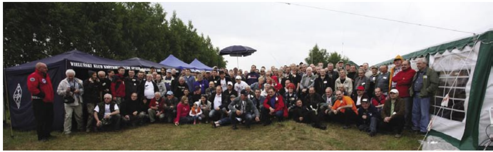
Uczestnicy ŁOŚ-a 2011

Kolejne prelekcje dotyczyły konstrukcji „home made”, ogólnie QRP, emisji D-Star konstrukcji antenowych. Wszystkie one cieszyły się ogromnym zainteresowaniem ze strony uczestników spotkania. Dla tych, którzy nie bywają na ŁOŚ-u dodam, że cały teren jest bardzo dobrze