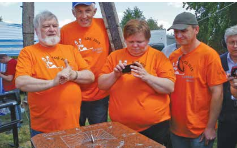
PO ODSŁONIĘCIU ZEGARA

Przygotowanie 14. edycji kongresu powierzono Kurkowemu Bractwu Strzeleckiemu w Tarnowskich Górach, którego tradycje sięgają 1780 r.