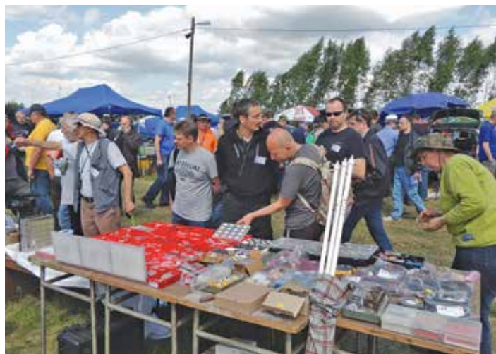
GIEŁDA NA ŁOŚ-U