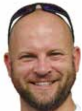
Vy 73! Remi SQ7AN

Trzy główne teksty w tym miesiącu zachęcają nas do działania. Fotorelacje z kolei do oglądania i planowania przyszłorocznych zlotów i spotkań, na które chcemy pojechać.