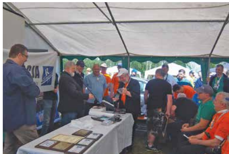
PREZES PZK WRĘCZA NAGRODY W KONKURSIE „RADIOREAKTYWACJI”