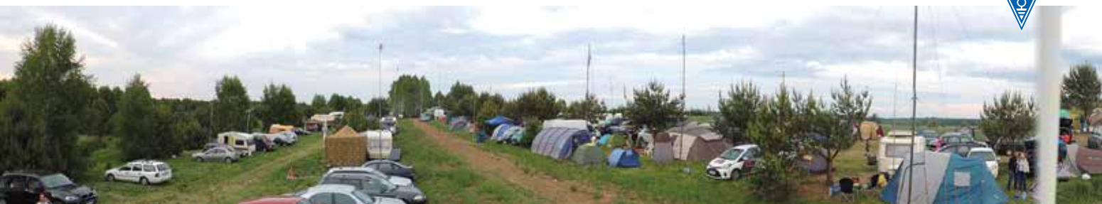
PANORAMA CZĘŚCI KWATERUNKOWEJ ŁOSIA