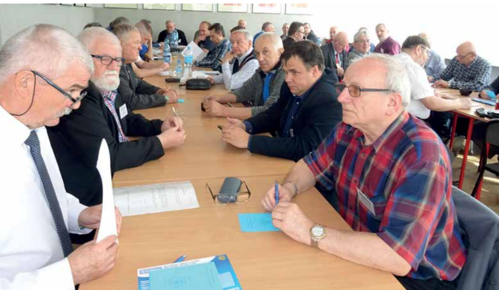
NA SALI OBRAD