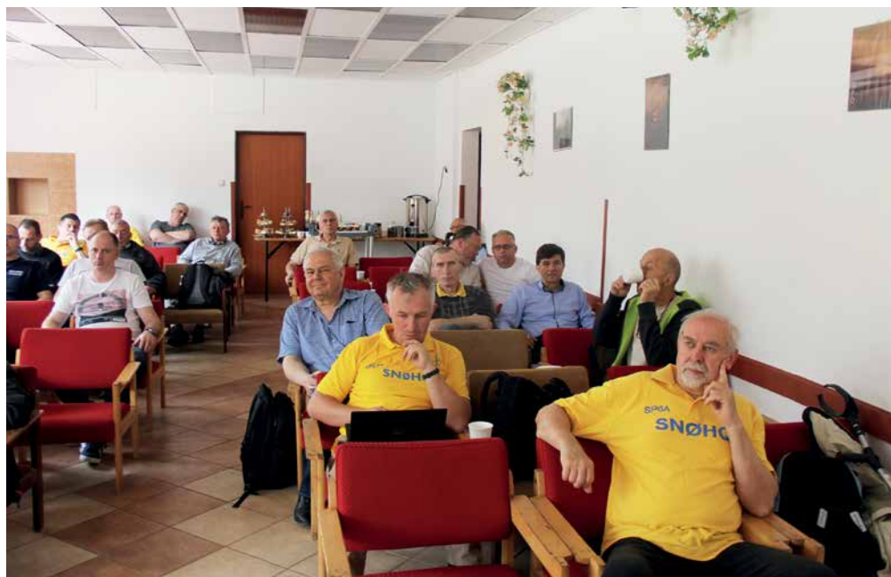
NA SALI OBRAD ZESPOŁU SN0HQ