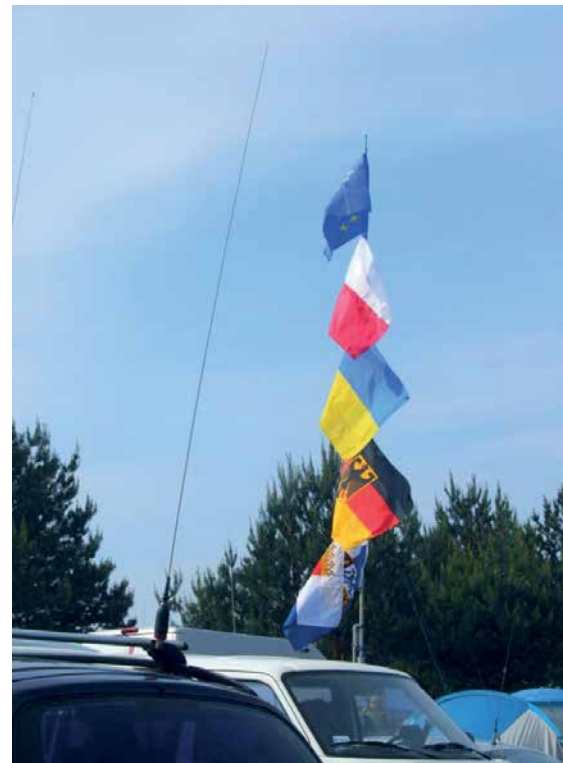
NA SPOTKANIU BYLI PRZEDSTAWICIELE Z WIELU KRAJÓW