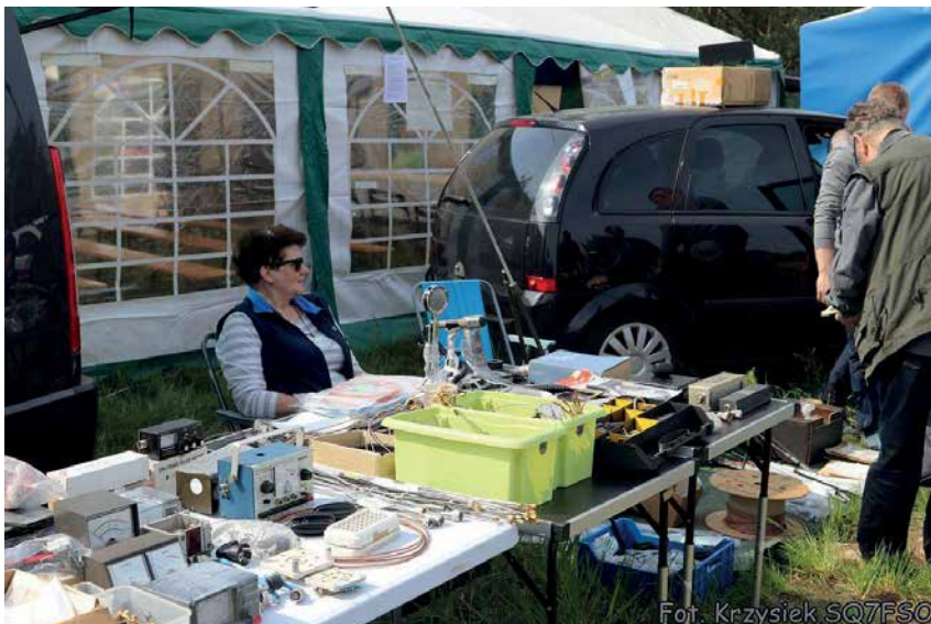
JEDNO ZE STOISK HANDLOWYCH