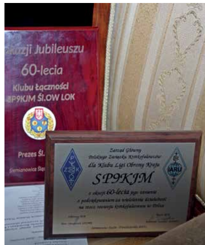
OKOLICZNOŚCIWE GRAWERTONY DLA KLUBU SP9KJM