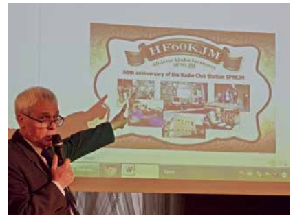
PREZENTACJA OKOLICZNOŚCIOWEJ KARTY QSL

P.S. Informacja na temat sobotniego spotkania, wraz z wieloma zdjęciami, ukazała się na siemianowickim portalu „Reporterskim okiem”: http://www.siemianowice.pl/aktualnosci/uroczystosc-60-lecia-klubu-lacznosci-sp9kjm.15115/ oraz na stronie klubowej SP9KJM http://sp9kjm.pl/index.php/2019/10/22/uroczystosc-60-lecia-klubu-lacznosci-sp9kjm-w-siemianowicach-sl/#more-2016 .