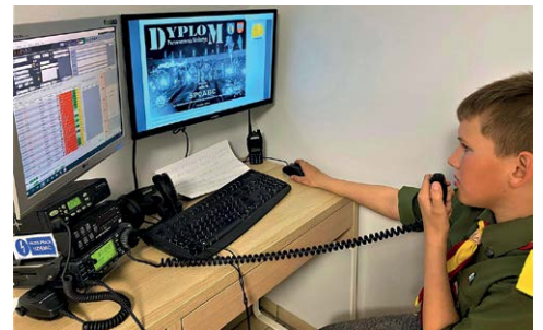
MŁODY OPERATOR Z WOLSZTYŃSKIEGO KLUBU SP3PWL. OBY WIĘCEJ TAKICH OBRAZKÓW, POKAZUJĄCYCH, ŻE PRZYBYWA NAM MŁODYCH ADEPTÓW KRÓTKOFALARSTWA

Należy zwrócić uwagę na fakt, iż z chwilą podniesienia wysokości składki członkowskiej zmalała liczba członków PZK. Wzrosła też liczba członków PZK, którzy przekroczyli 71 rok życia, co wiąże się z pomniejszoną składką członkowską tych